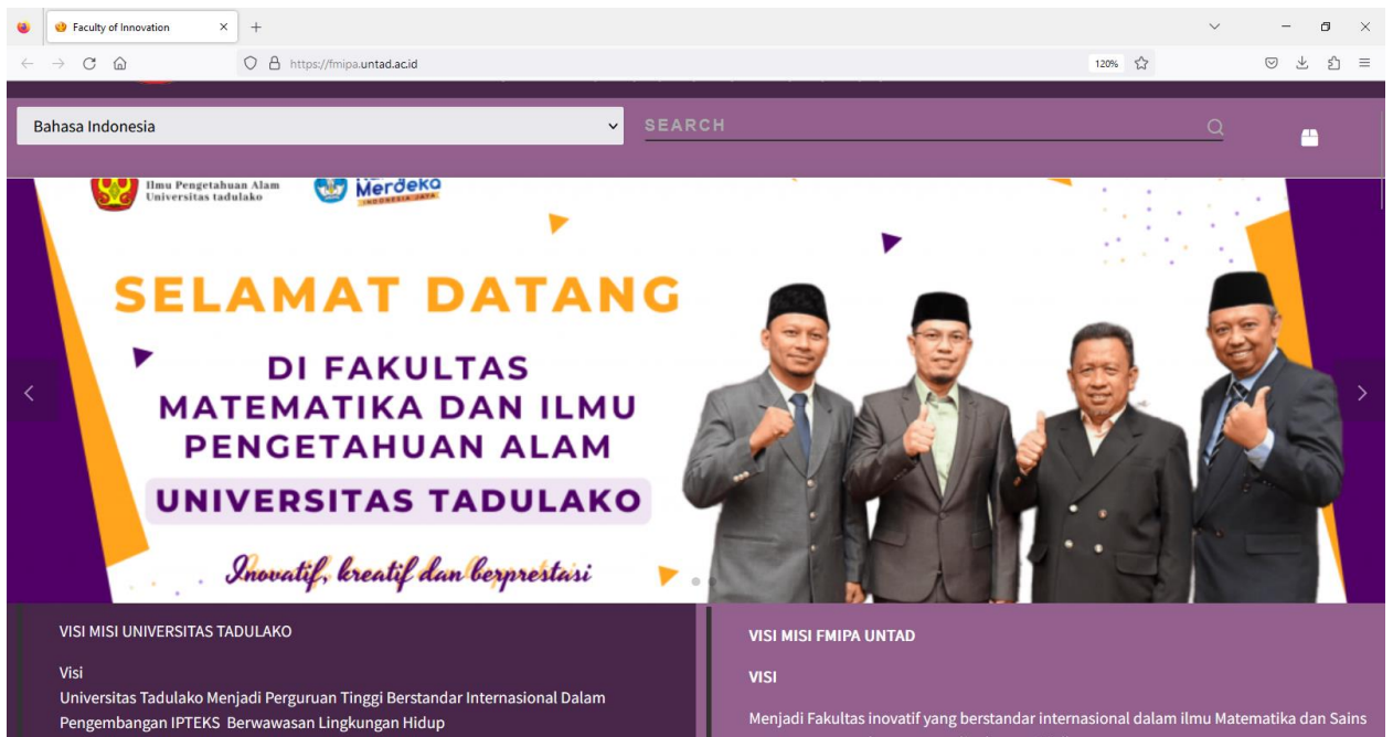
Gambar 3. Tampilan depan laman sistem informasi FMIPA Untad.

Sistem Informasi Akademik Fakultas MIPA adalah sistem informasi yang sudah dibangun dan diterapkan di Fakultas MIPA untuk meningkatkan pelayanan kepada mahasiswa FMIPA Universitas Tadulako. Sistem Informasi ini dikembangkan oleh Pusat Informasi FMIPA sebagai sebuah Unit di dalam Fakultas MIPA Untad. Sistem ini sudah memberikan informasi tentang Profil Fakultas, Akademik, Kemahasiswaan, Kegiatan dan SiakadMIPA. Sistem Informasi ini dapat diakses di https://fmipa.untad.ac.id/ . Tampilan depan Sistem Informasi FMIPA seperti pada gambar 3 berikut (menu layanan):